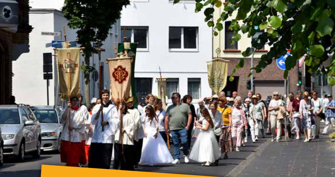
Fronleichnam St. Martin, Euskirchen